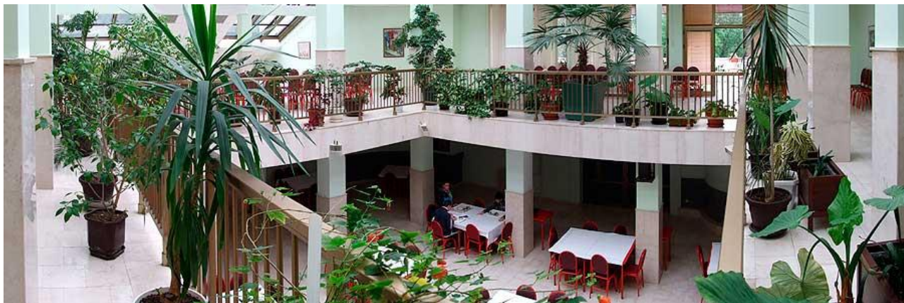
La studenta restoracio

Eblos loĝi ankaŭ en proksimaj urbaj hoteloj kaj manĝi tie aŭ en multaj restoracioj kaj bakejoj proksime de la kongresejo. La plej proksima al la kongresejo estas la hotelo "Beograd" en la senaŭtomobila strato de urbocentra promenejo, sed ankaŭ aliaj hoteloj aŭ apartamentoj rezerveblas per booking.com por Ĉaĉak.